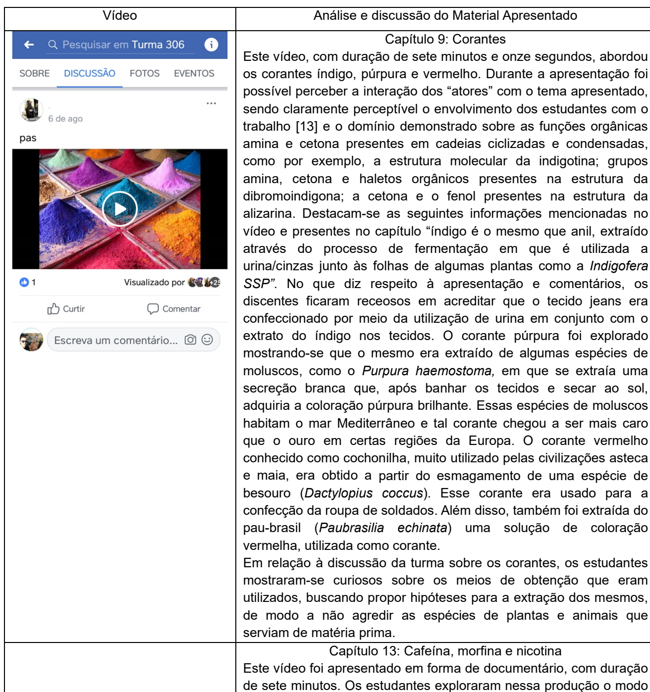
Quadro 03: Análise e discussão dos vídeos

A partir da aplicação da proposta foram produzidos 18 (dezoito) vídeos, sendo descritos no Quadro 03, os vídeos de maior relevância para os estudantes, após a análise e discussão na turma.